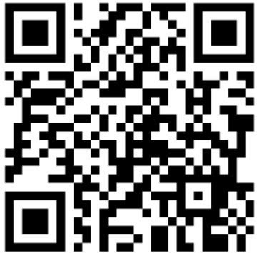
PAU Junio 2021 Comunidad Valenciana

No dejes de revisar mi canal, pues iré añadiendo nuevos.