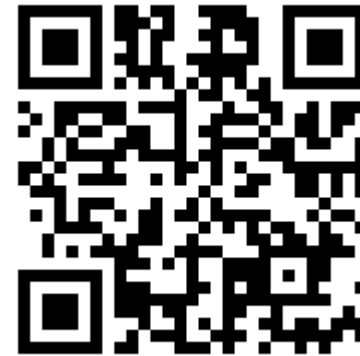
PAU Julio 2022 Comunidad Valenciana