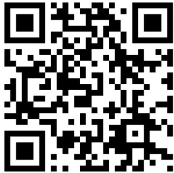
PAU Junio 2021 Comunidad Valenciana

No dejes de revisar mi canal, pues iré añadiendo nuevos.