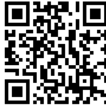
PAU Septiembre 2020 Comunidad Valenciana