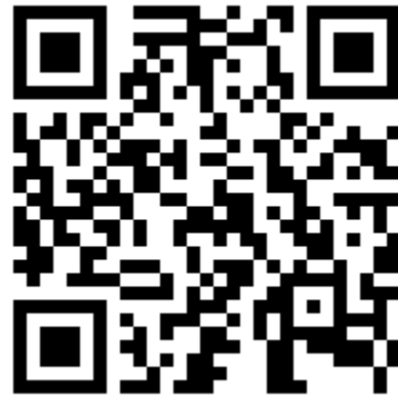
PAU Junio 2021 Comunidad Valenciana